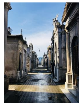
Cimetière de Recoleta

L'Argentine est un pays en voie de développement diversifié en paysages et climats, et surtout connu pour sa capitale Buenos Aires et Ushuaia, la ville la plus australe au monde. Ce pays comprend quatre grandes régions : el Norte Argentino, le centre avec Buenos Aires, el Nuevo Cuyo à l'Ouest et la Patagonie au Sud avec Ushuaia. J'ai eu la chance de voyager dans ces quatre régions et de comprendre que chacune a ses particularités. Par exemple, à Buenos Aires, on peut tout faire, à toute heure : visites touristiques (La Plaza de Mayo, le quartier de La Boca, le cimetière de Recoleta, le Teatro Colón...), se restaurer (avec la milanesa, les empanadas, les choripan, les alfajores, le dulce de leche), tester les bars du quartier de Palermo Soho, faire du bateau à Tigre, et j'en passe !!