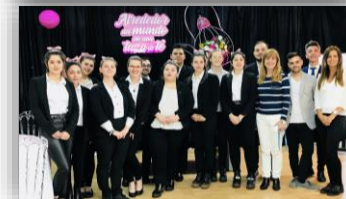
Activités et séminaires à l'Université de Morón