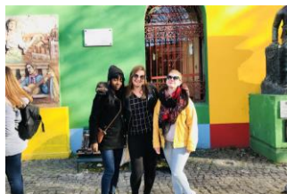
Quartier « La Boca »

L'Argentine est un pays en voie de développement diversifié en paysages et climats, et surtout connu pour sa capitale Buenos Aires et Ushuaia, la ville la plus australe au monde. Ce pays comprend quatre grandes régions : el Norte Argentino, le centre avec Buenos Aires, el Nuevo Cuyo à l'Ouest et la Patagonie au Sud avec Ushuaia. J'ai eu la chance de voyager dans ces quatre régions et de comprendre que chacune a ses particularités. Par exemple, à Buenos Aires, on peut tout faire, à toute heure : visites touristiques (La Plaza de Mayo, le quartier de La Boca, le cimetière de Recoleta, le Teatro Colón...), se restaurer (avec la milanesa, les empanadas, les choripan, les alfajores, le dulce de leche), tester les bars du quartier de Palermo Soho, faire du bateau à Tigre, et j'en passe !!